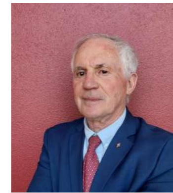
Jean-Paul ROCHE Président de la Communauté de Communes des Portes de Sologne

Portes de Sologne COMMUNAUTÉ DE COMMUNES