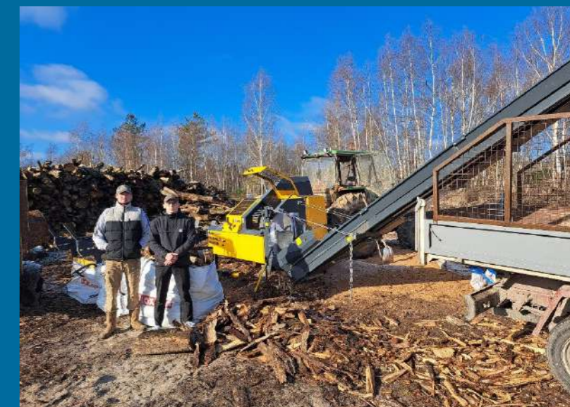
L'entreprise VMV BOIS, créée en 2022 et spécialisée dans l'exploitation forestière et la vente de bois de chauffage pour particulier, a bénéficié d'une subvention de la Communauté de Communes pour l'acquisition d'un combiné chauffage indispensable pour le développement de leur activité.

Pour plus de renseignements, contactez le Responsable du Développement Économique au 02.38.61.93.84 ou par mail à l'adresse suivante : lroumet@ccportedesologne.fr