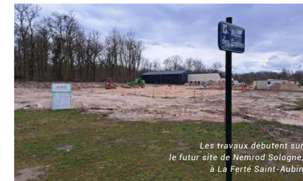
Les travaux débutent sur le futur site de Nemrod Sologne, à La Ferté Saint-Aubin

« Nemrod est une entreprise qui projette de grandir pour proposer un débouché sur l'ensemble du territoire français, au plus proche de ses partenaires, les